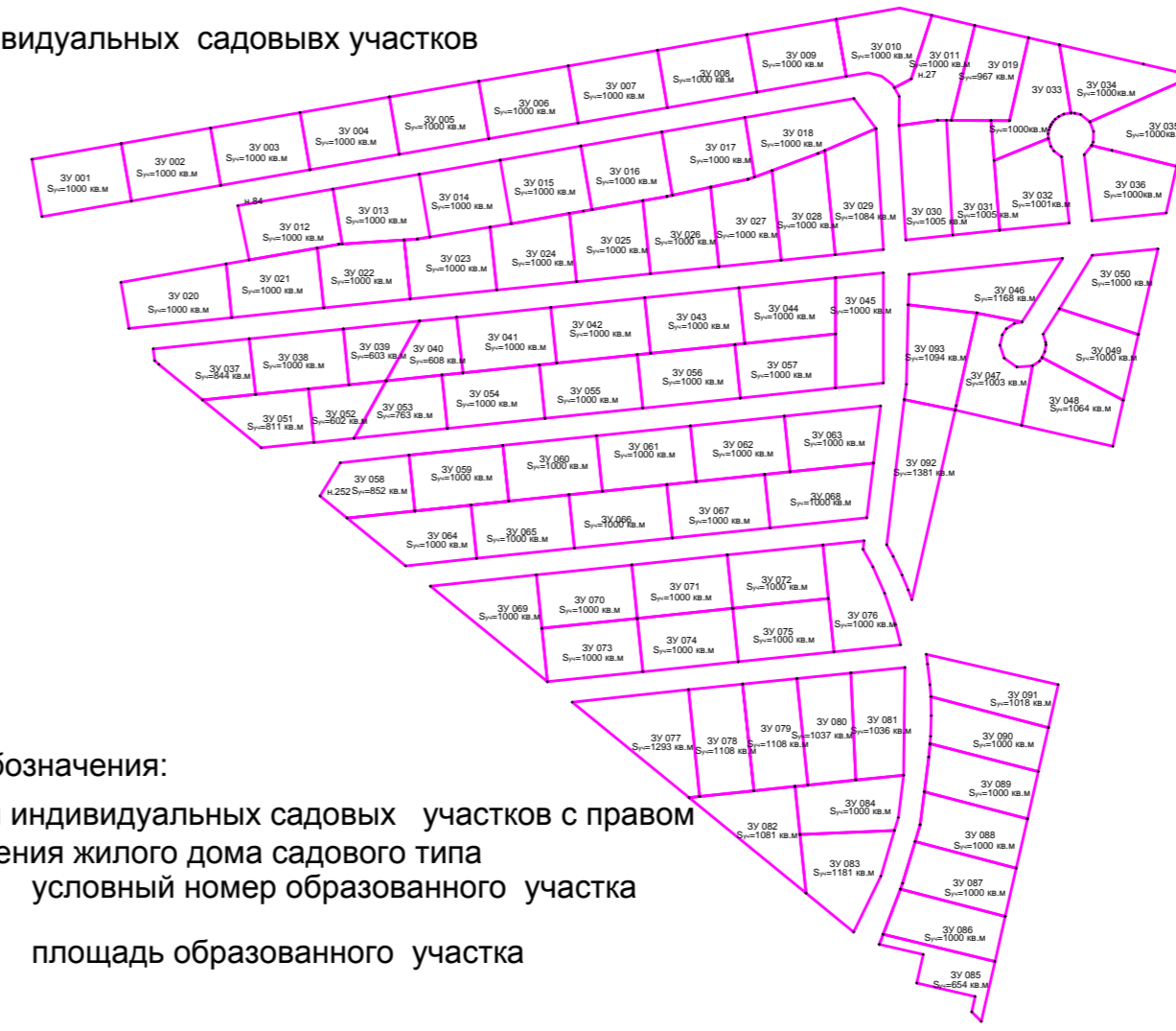
Границы индивидуальных садовых участков М 1:3155