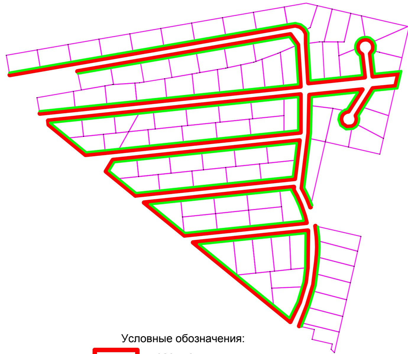
Красные линии и линии отступа от них М 1:2816